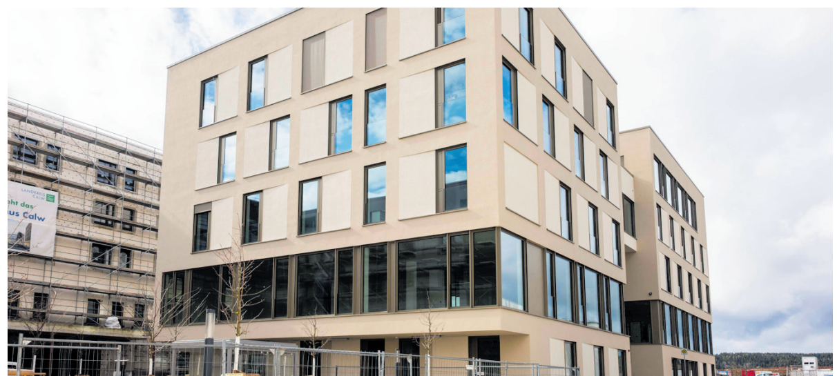
Der Pflegestützpunkt Calw ist jetzt auf dem Gesundheitscampus zu finden.

Der Pflegestützpunkt berät Pflegebedürftige und deren Angehörige kostenfrei