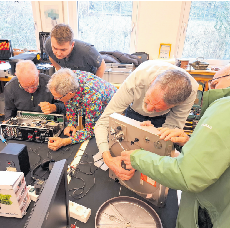
Das Ziel lautet: Hilfe zur Selbsthilfe.