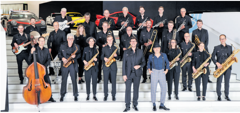
Die Porsche Big Band kommt nach Nagold.