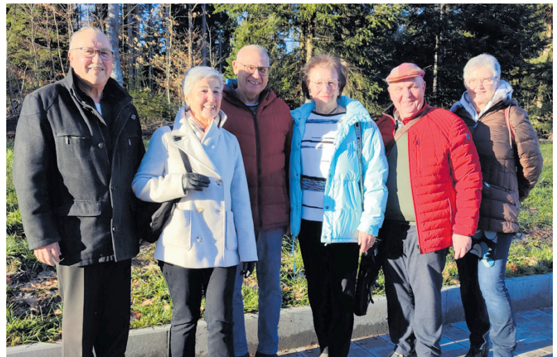
Der Vorstand des Kreissenorenrates hat sich im Zentrum für Psychiatrie ein Bild von der Einrichtung gemacht.

Im Klinikum Nordschwarzwald sowie in den sieben teil- und vollstationären gemeindenahen Einrichtungen werden jährlich mehr als 10.000 Patientinnen und Patienten versorgt.