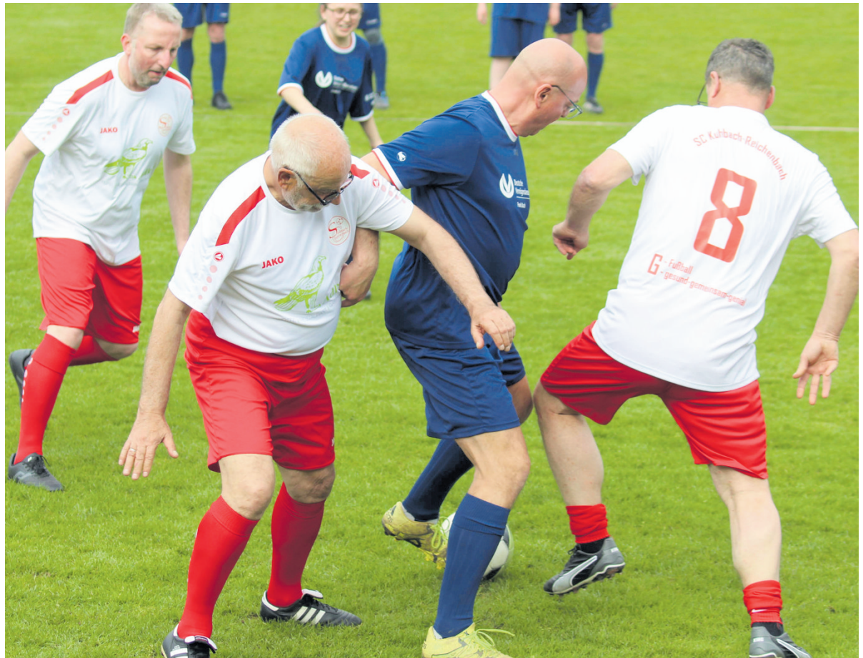
Beim Walking-Football hat sich eine besondere Form des Fußballs etabliert.