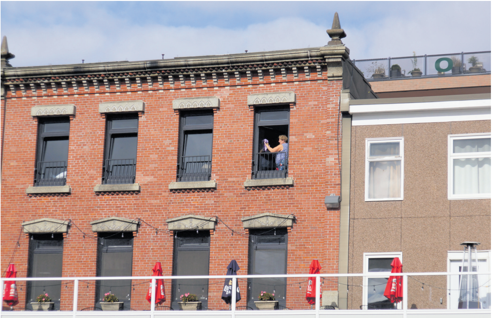
Eigentlich sott mr uff dia Scheiba glei von vorna her a Schildle druffbeba, wo alle Notfallnummra druff stehn.