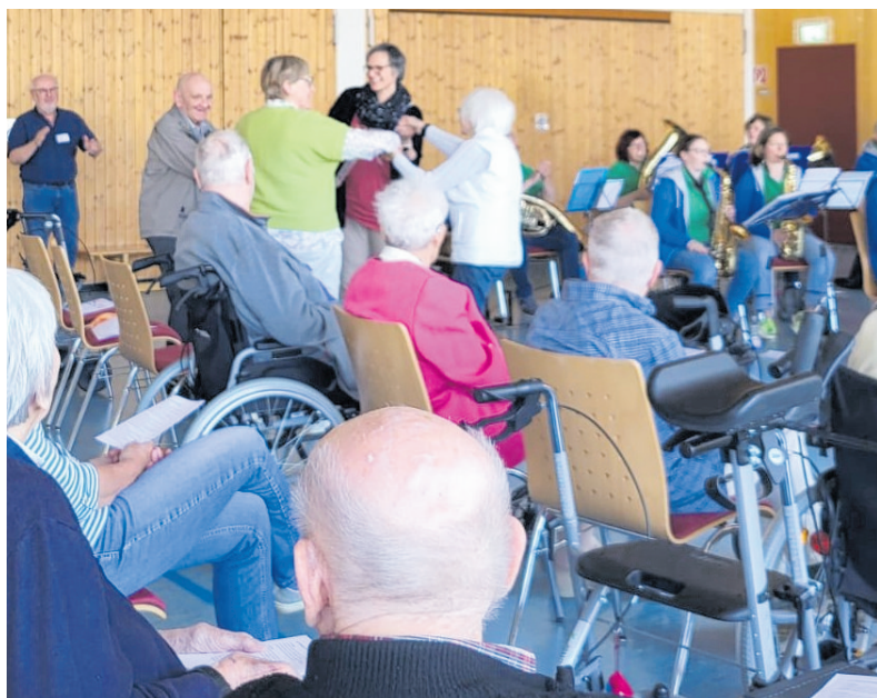
Die Konzertreihe MusikUnvergessen zeigt, wie wertvoll Musik für Menschen mit Demenz ist.