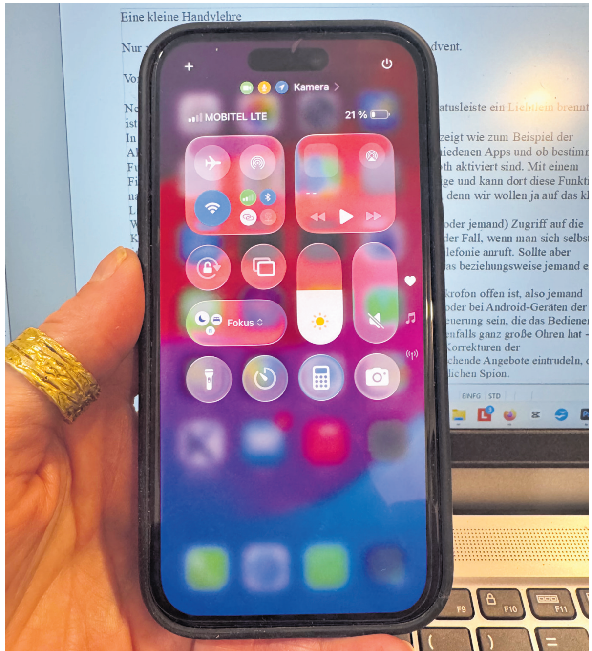
In der Statusleiste werden verschiedene Informationen angezeigt wie zum Beispiel der Akkuladestand, die Netzstärke, Benachrichtigungen von verschiedenen Apps.

Das kann bei Apple die Assistentin „Siri“ sein, oder bei Android-Geräten der „Google-Assistant“. Natürlich kann es auch jede andere Sprachsteuerung sein, die das Bedienen des Handys leichter